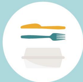
Talheres de plástico 400 anos