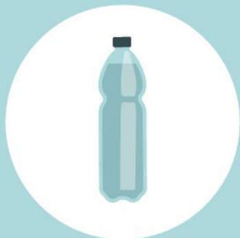
Garrafa de plástico 500 anos