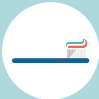
Escova de dentes 500 anos

Apesar de apenas usarmos os objetos de plástico por breves minutos, estes demoram centenas de anos para desaparecer.