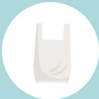
Saco de plástico 400 anos